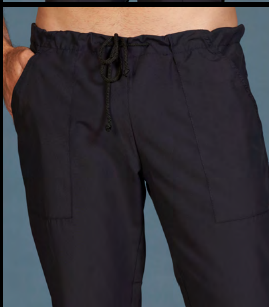
ACRS ACRI SET