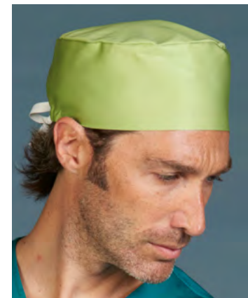
CF3 CUFFIA / CAP