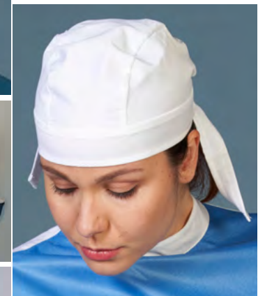
CF4 CUFFIA / BANDANA CAP