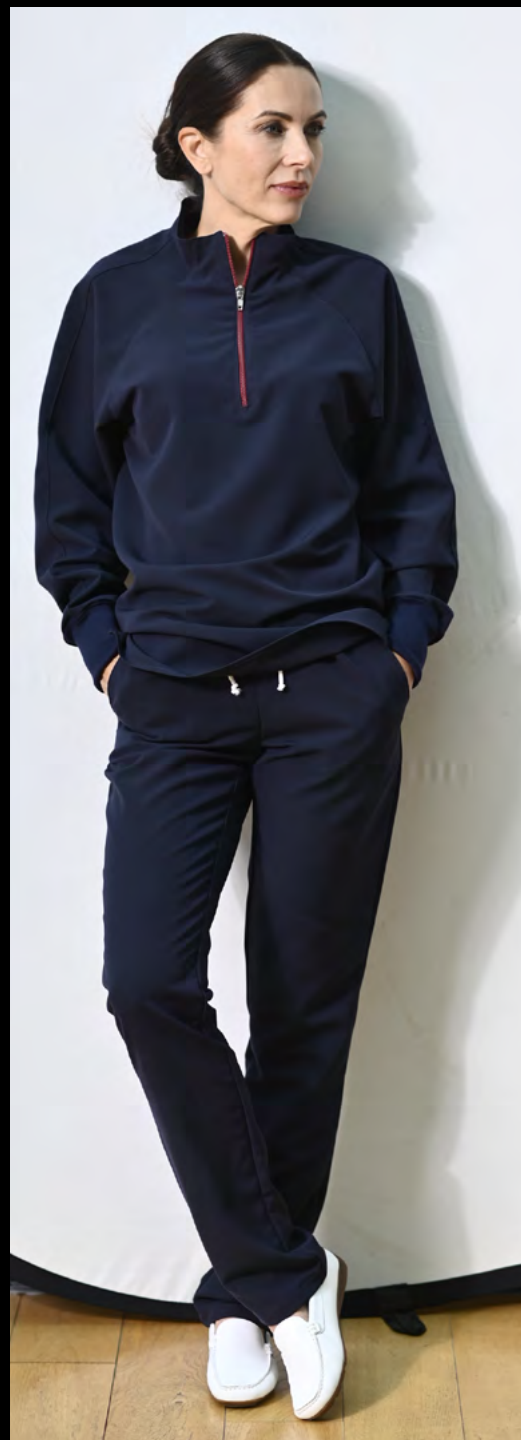
GB01 Unisex Set GAND GREEN BLOCK