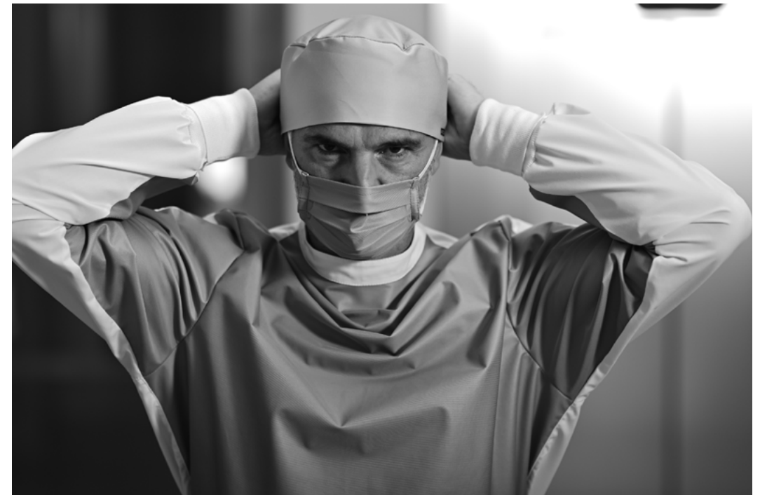
MS01TTR MASCHERINA / MASK