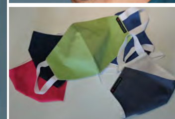
MASCHERINA / MASK: MS01 MS03 MS02